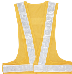
YW[イエロー+ホワイト]