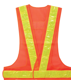
OL[オレンジ+ライムイエロー]

定価 2,400 円 税別販売価格 1,440 円 ※名入れは別途お見積り致します