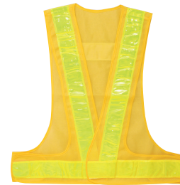
YL[イエロー+ライムイエロー]