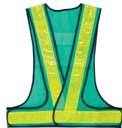
GL[グリーン+ライムイエロー]