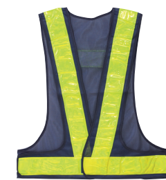
BL[紺+ライムイエロー]