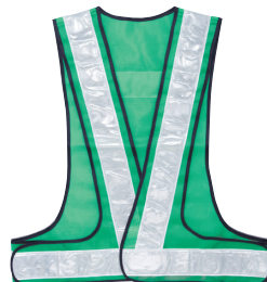
GW[グリーン+ホワイト]