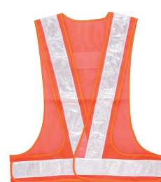
OW[オレンジ+ホワイト]